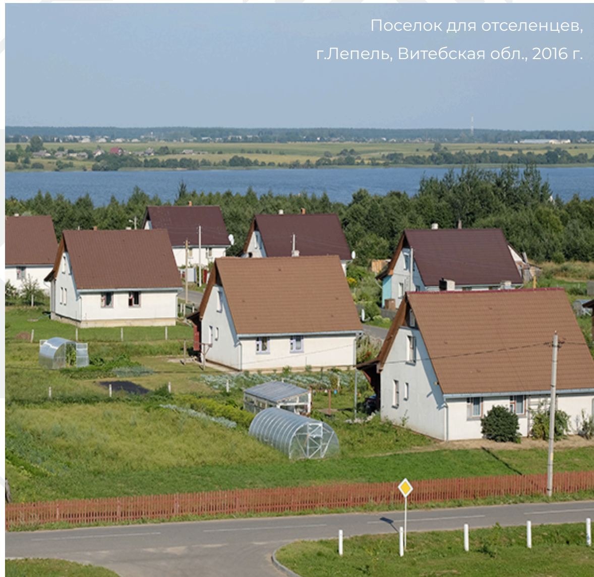
Поселок для отселенцев, г.Лепель, Витебская обл., 2016 г.

Разработан и функционирует комплекс адресной поддержки для пострадавших граждан