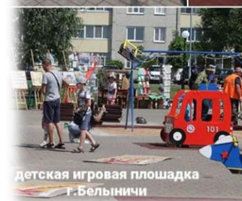
детская игровая площадка г.Бельниччи

Детская площадка «Партизанская поляна» обустроена при поддержке Могилевской областной Ассоциации местных Советов депутатов в Год исторической памяти г.Кличев