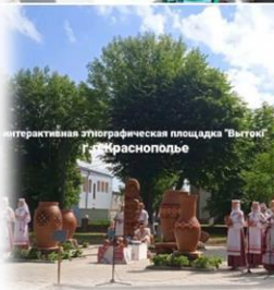
Интерактивная этнографическая площадка «Вытоки» г.Краснополье