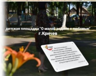
детская площадка «О малой родине с любовью» г.Кричев