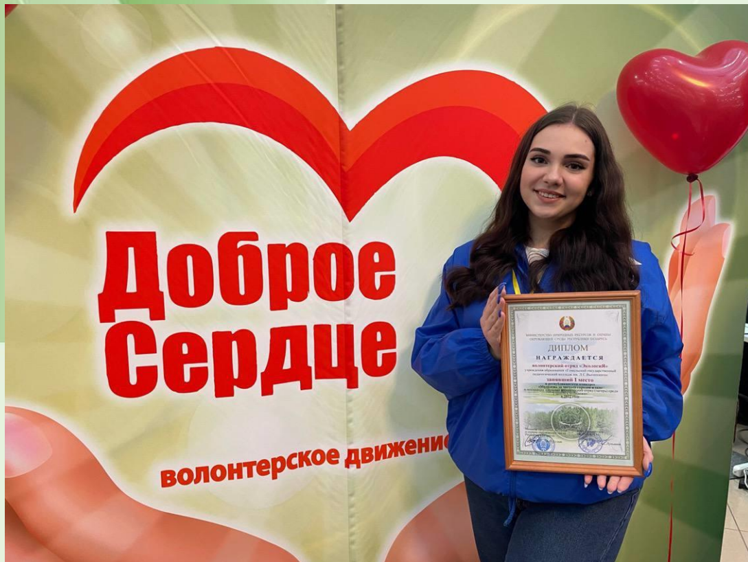
ВОЛОНТЕРСКИЙ ОТРЯД «ЭКОЛОГИЯ»