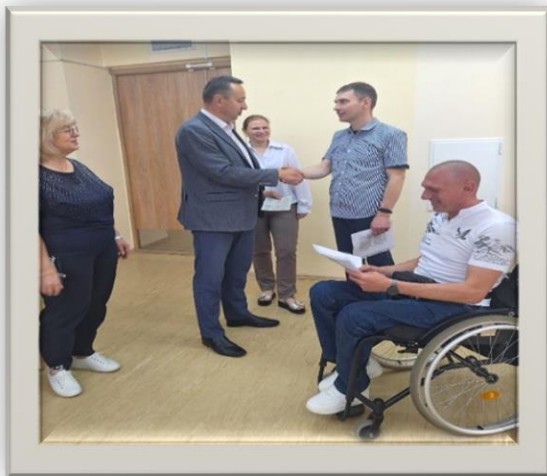
Прошел обучение по профессии «обувщик по ремонту обуви»