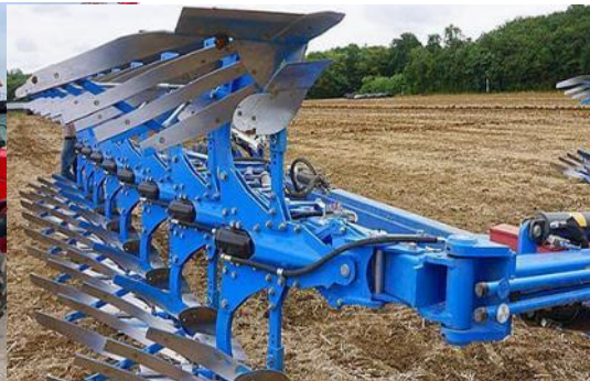
Закупка новой сельскохозяйственной техники