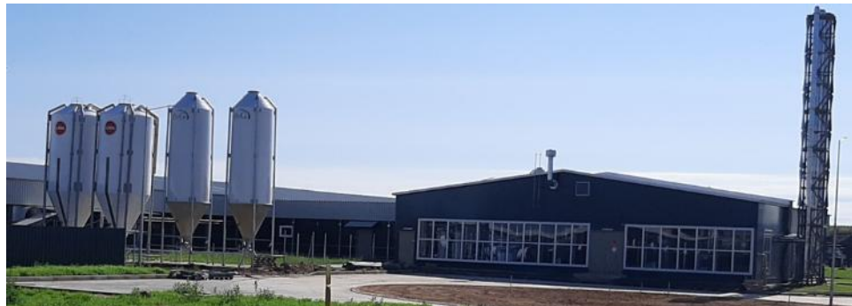
Строительство свиноводческих репродукторов