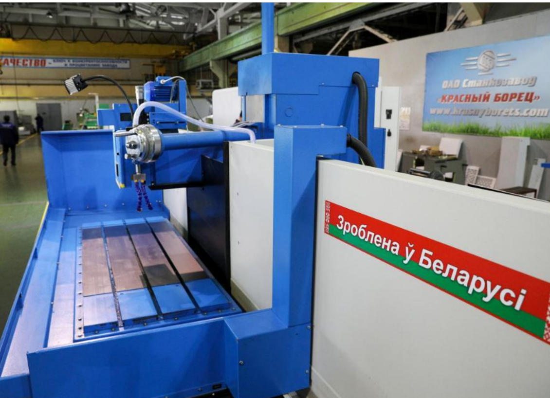
ОАО «Красный Борец»