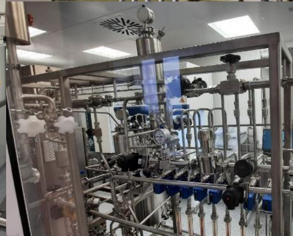
Иностранное унитарное предприятие «ВИК-здоровье животных»